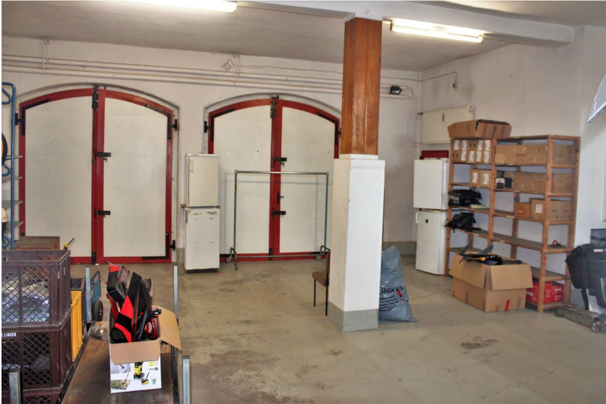
Innenansicht vom Erdgeschoss (Lager 02)