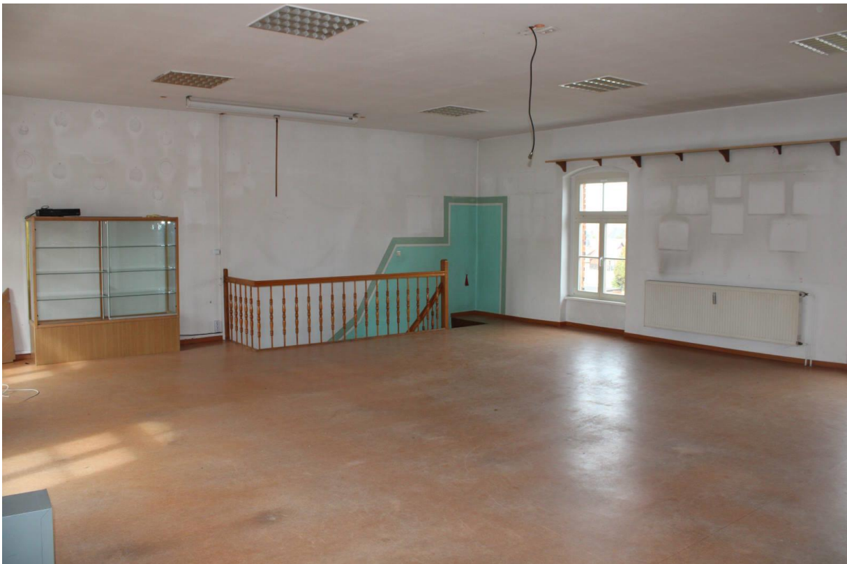
Innenansicht vom Obergeschoss (Saal mit Aufgang vom Erdgeschoss)