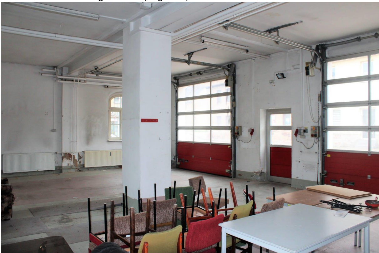
Innenansicht vom Erdgeschoss (Lager 01)