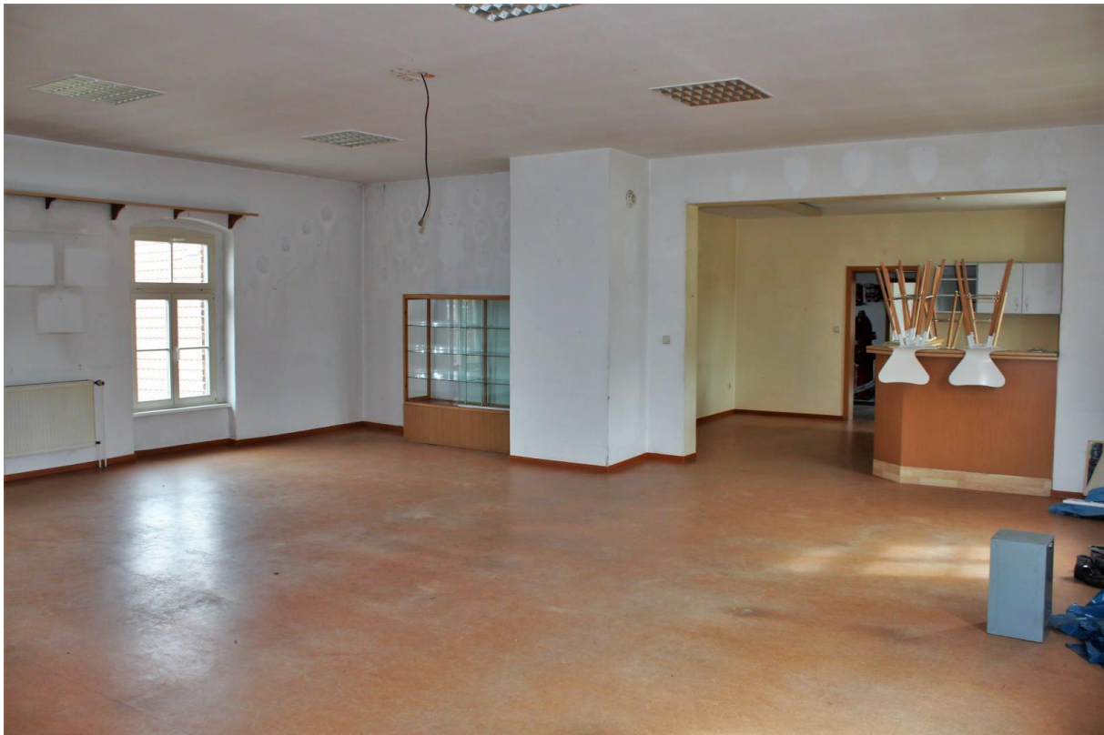
Innenansicht vom Obergeschoss (Saal mit Vorraum)