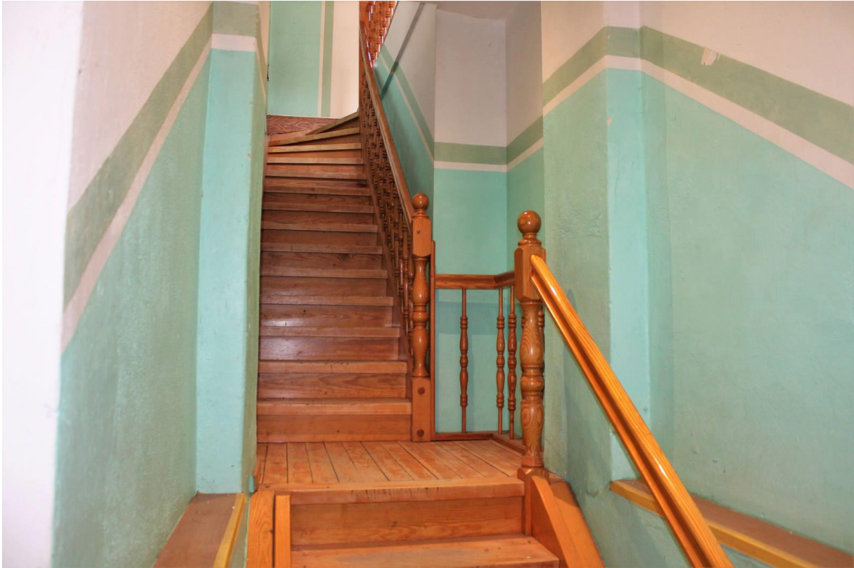
Innenansicht vom Erdgeschoss (Treppe zum Obergeschoss)