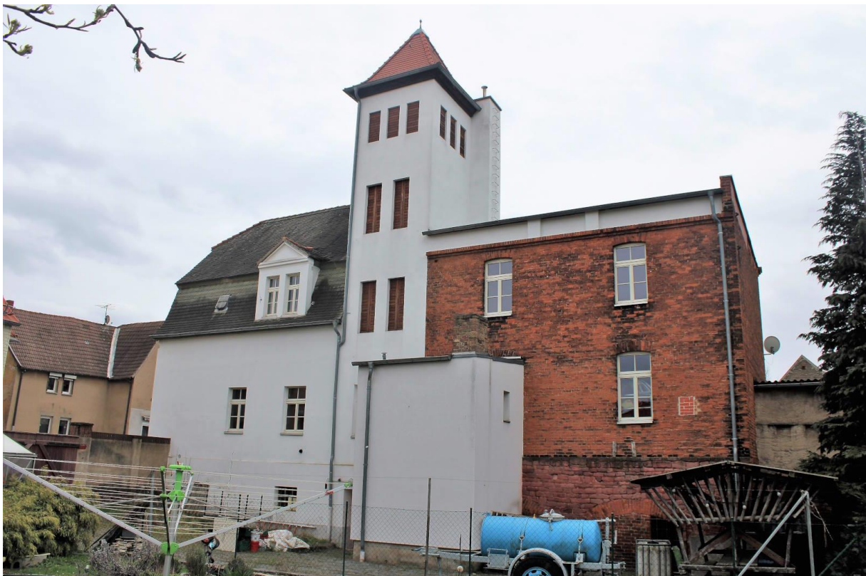
Rückansicht vom Gesamtgebäude mit Schlauchturm